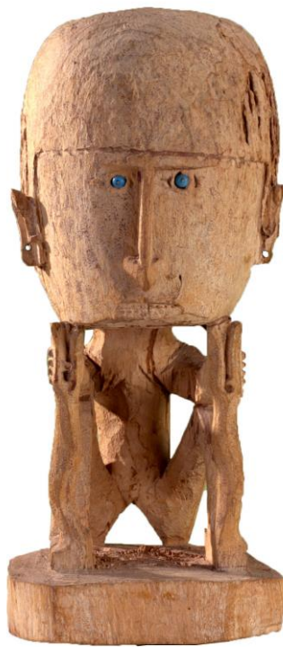
Afstudeeronderwerp Reinwardt Academie: Schedelkorwar. Papua, Indonesië. Coll. nr. 54098

Een student aan de Reinwardt Academie studeert af op herkomstonderzoek naar een specifiek voorwerp uit onze collectie: een schedelkorwar uit Papua, Indonesië (coll. nr. 54098).