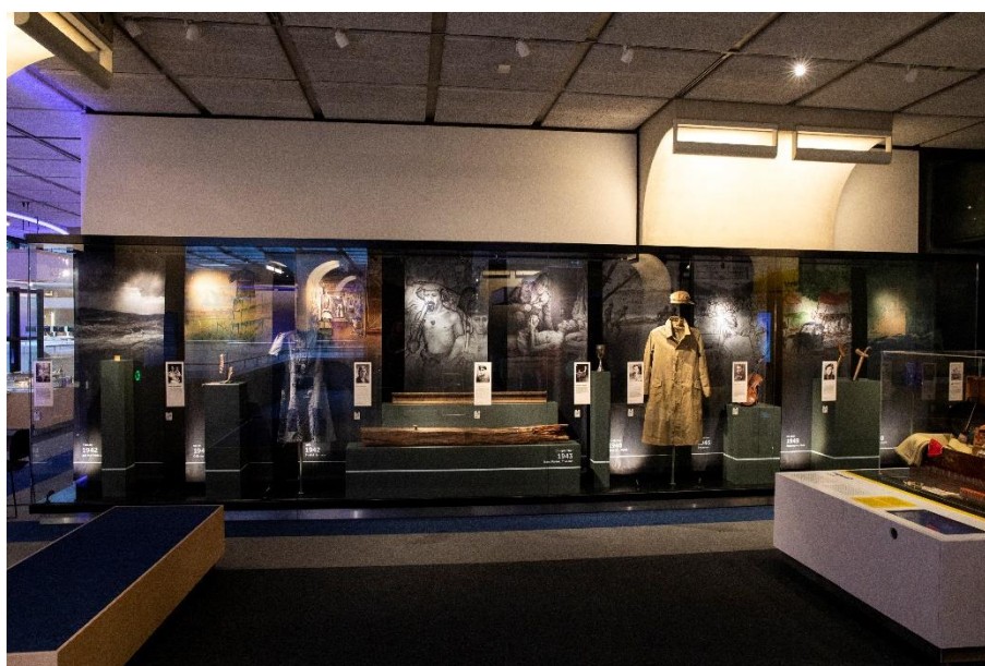
In de tijdelijke tentoonstelling Getekend. Persoonlijke verhalen over de Japanse bezetting

Los van onze collectiegerichte tentoonstellingen zoals Getekend over Nederlands-Indië in de Tweede Wereldoorlog en de integratie van collectie in andere tijdelijke opstellingen zoals onze National Geographic fototentoonstellingen of de natuurfototentoonstellingen de Groene Camera zijn we bezig geweest om een snellere roulatie van collectie in onze vaste tentoonstellingen te bewerkstelligen. Met name komt dat tot uitdrukking in de One Planet Expo op de eerste verdieping, waar de kolom- en wandvitrines elk een soort thematische minitentoonstelling vormen; het streven is om per jaar twee of drie vitrines te vervangen. Daarnaast richten we als vast onderdeel van onze programmering elke één of twee weken een vitrine in waarin we met collectie reageren op onderwerpen uit de actualiteit. ChatGPT, het VN-akkoord over de oceanen, de discussie over het tot leven wekken van uitgestorven soorten, het Surinaamse dilemma met betrekking tot het boren naar olie en de discussies rond koloniaal erfgoed zijn voorbeelden van onderwerpen die inmiddels de revue zijn gepasseerd.